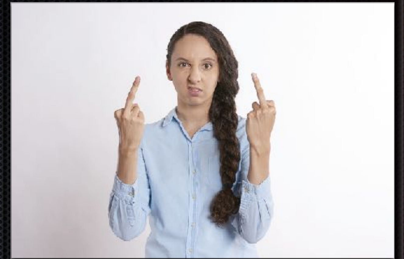
③強盗に立ち向かう