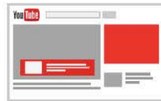
オーバーレイ広告 パソコンのみ