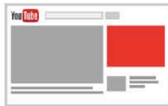
ディスプレイ広告 パソコンのみ（必須）