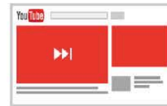
スキップ可能な動画広告 すべての端末